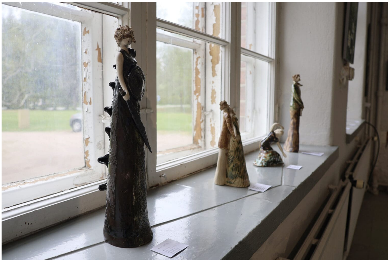
Ikkunanruudut kehystävät keramiikkatöitä.

SEURAN vuosinäyttelyä Erkkola-Järvinen kuvailee sisällöltään sulatusuuniksi. Esillä on paljon veistoksia ja vieläpä eri materiaaleista tehtyjä. Mukana on keramiikkaa, metallia, lasia ja kierrätysmateriaalia. Taulut ovat muun muassa vesiväri- ja akryylitöitä, akvarelleja ja grafiikkaa.