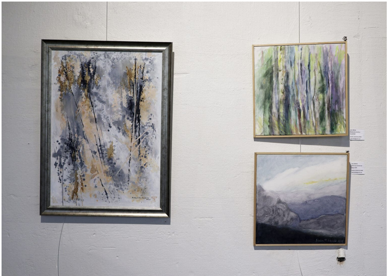
Sisko Mikkilän teokset ovat akryylitöitä.