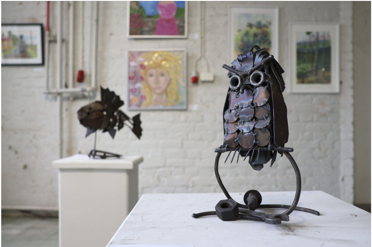
Näyttelyssä on esillä runsaasti veistoksia.

– Monelle on käynyt niin, että kun on liittynyt seuran jäseneksi, niin jäsenyys on kestänyt kuolemaan saakka. Minullakin on nyt jo 47. vuosi menossa, Erkkola-Järvinen kertoo.