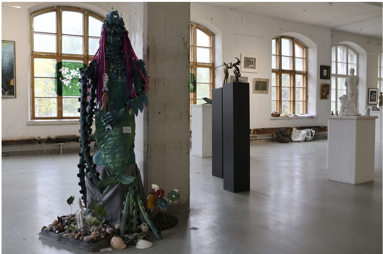
Ursula ottaa taidenäyttelyssä kävijät vastaan salin toisella ovella.